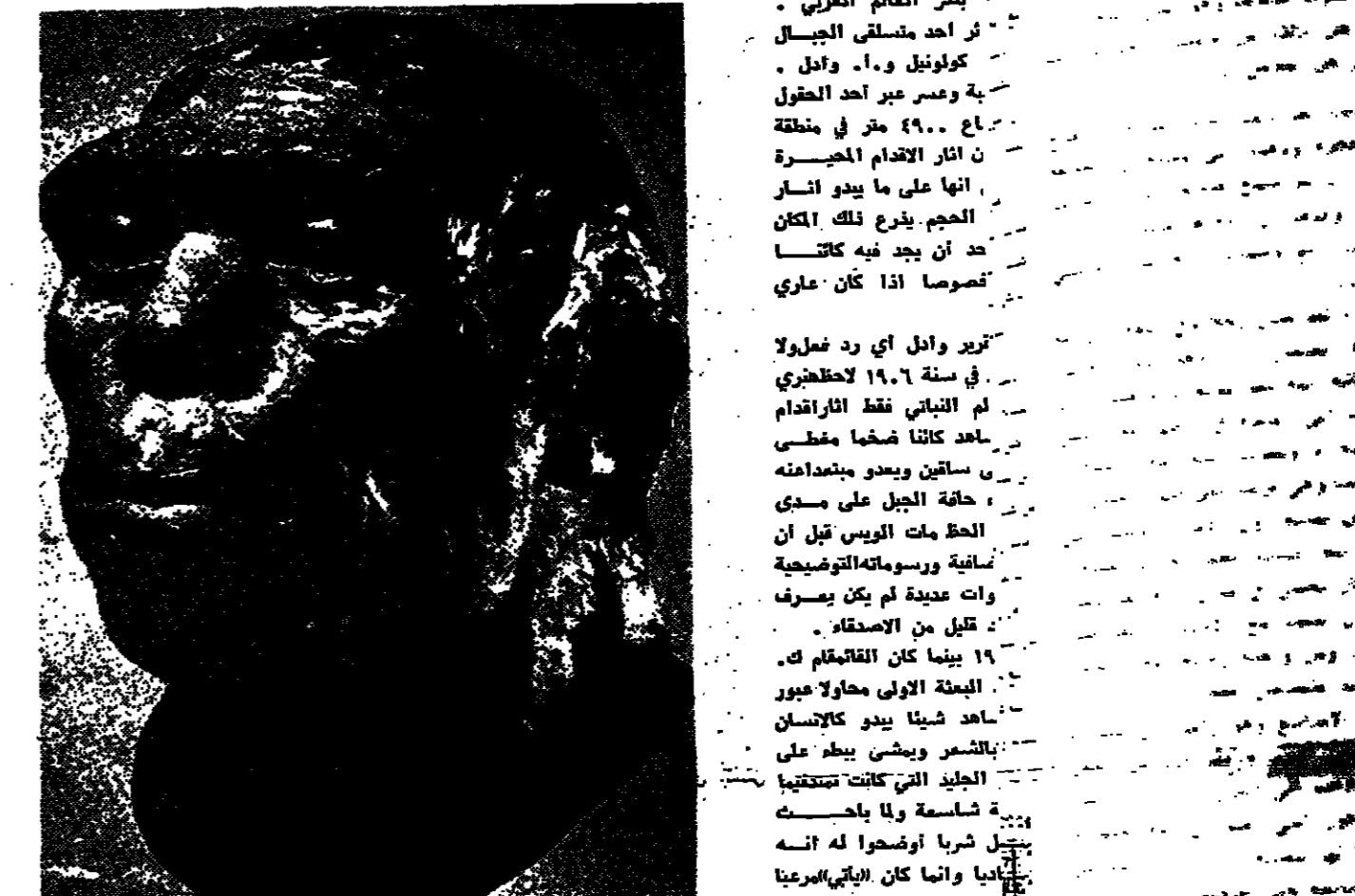
تير ويلد اول من عرف في سنة ١٩٠٦ لاطخري في التبانة فقط التارادام...